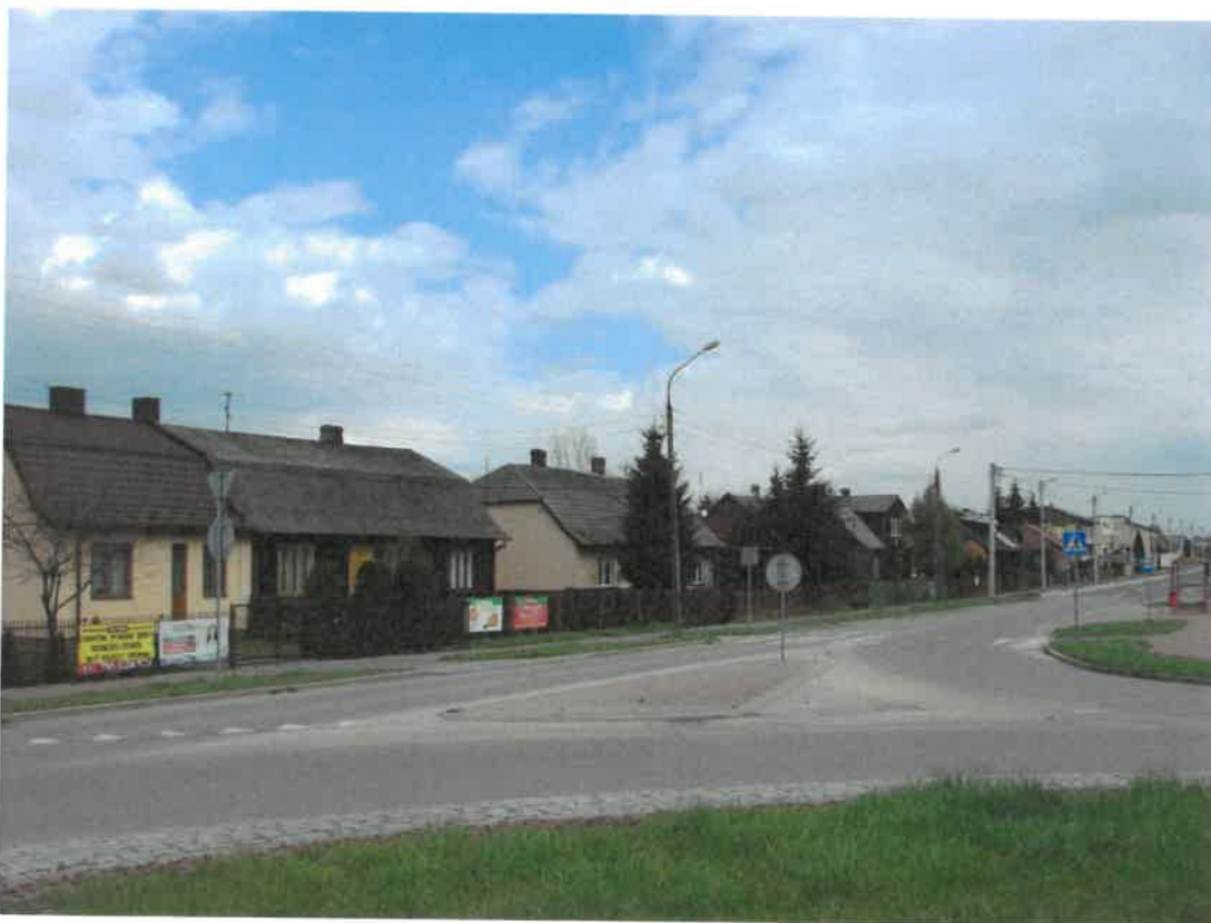
Pozostałości dawnej zabudowy Skarżyska Kościelnego, m.in. dom drewniany z dachem mansardowym