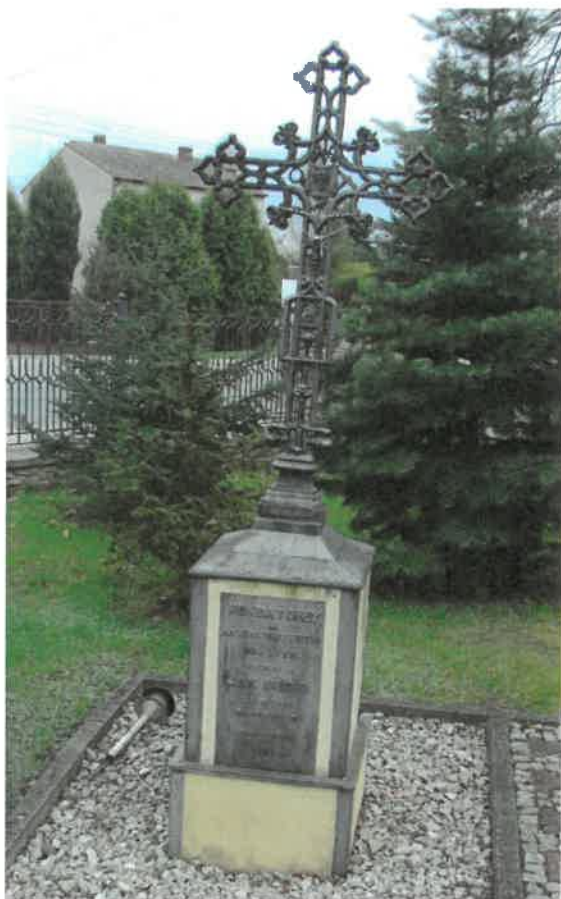
Krzyż wotywny przy kościele

Cechą charakterystyczną krajobrazu są również kapliczki, murowane z kamienia piaskowcowego (surowca dostępnego), które według tradycji zastępowały dawniejsze krzyże drewniane, ustawiane w tych samych miejscach. W związku z rozwojem przemysłu, pojawiają się również krzyże żeliwne, często jako wota dziękczynne, np. krzyż na terenie przykościelnym, czy pomniki nagrobne z końca XIX wieku na cmentarzu parafialnym.