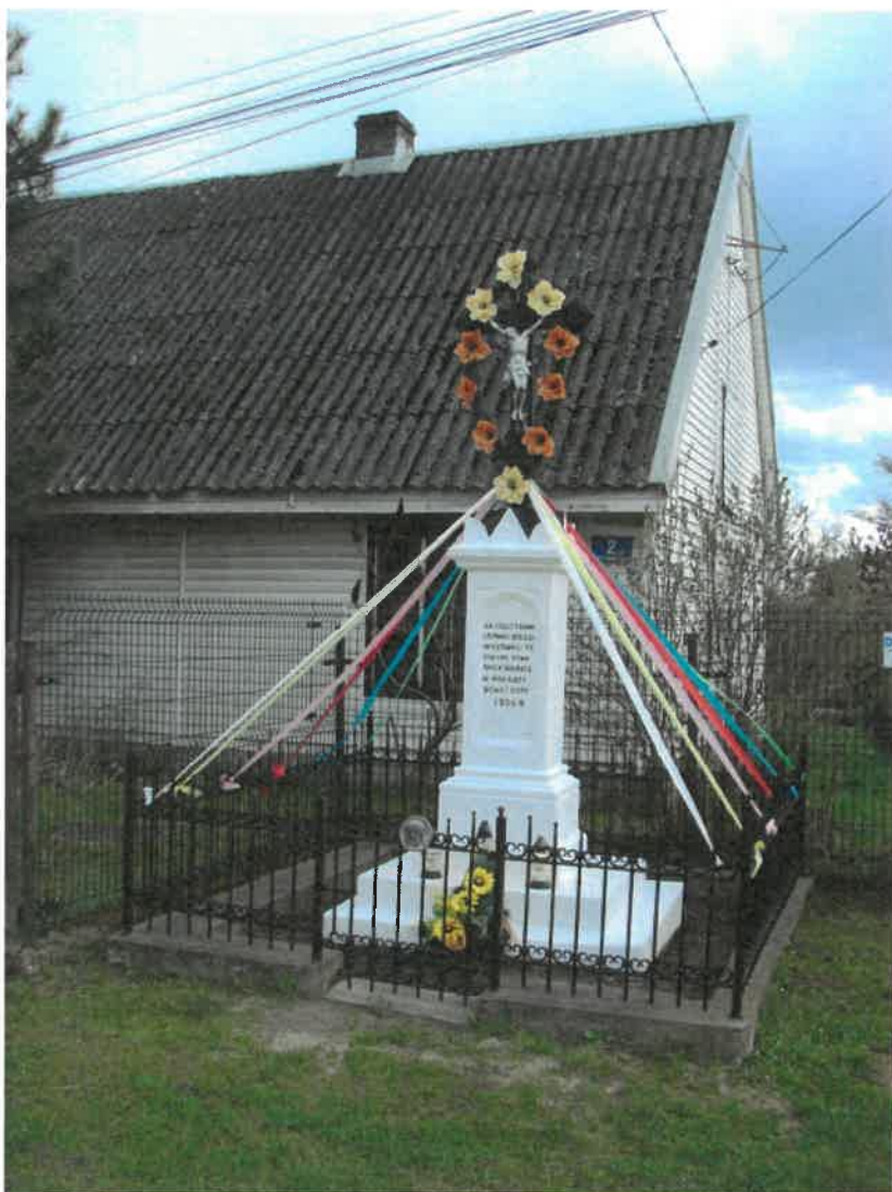
Krzyż wotywny wystawiony przez robotników fabrycznych w Grzybowej Górze