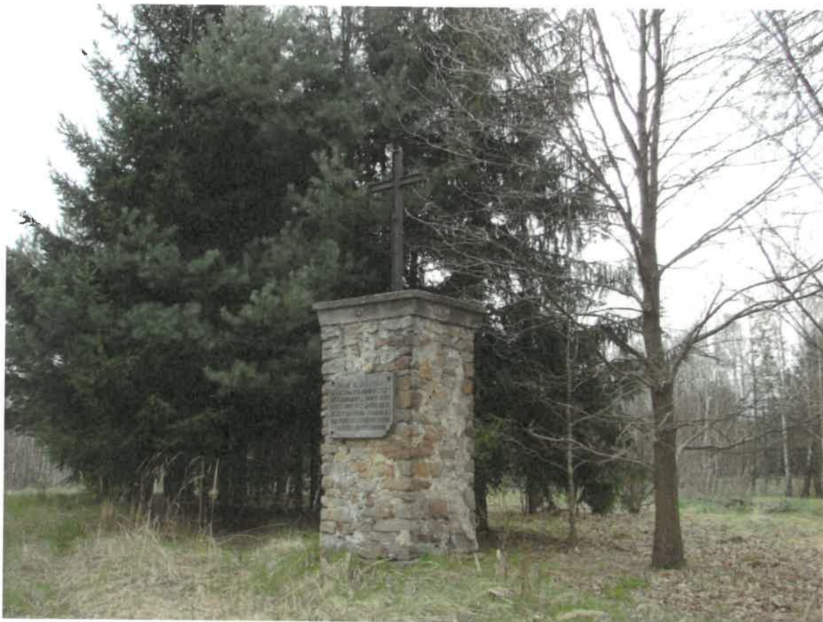
Triangul z 1829 roku w Lipowym Polu Plebańskim

W XIX w związku z tworzeniem nowych zakładów przemysłowych w dorzeczu Czarnej i Kamiennej, w latach 1829-1835 przeprowadzono pomiary i wytyczono jedną z najstarszych na ziemiach polskich sieć geodezyjną, której pozostałością jest zachowany w Lipowym Polu Plebańskim znak geodezyjny, tzw. triangul.