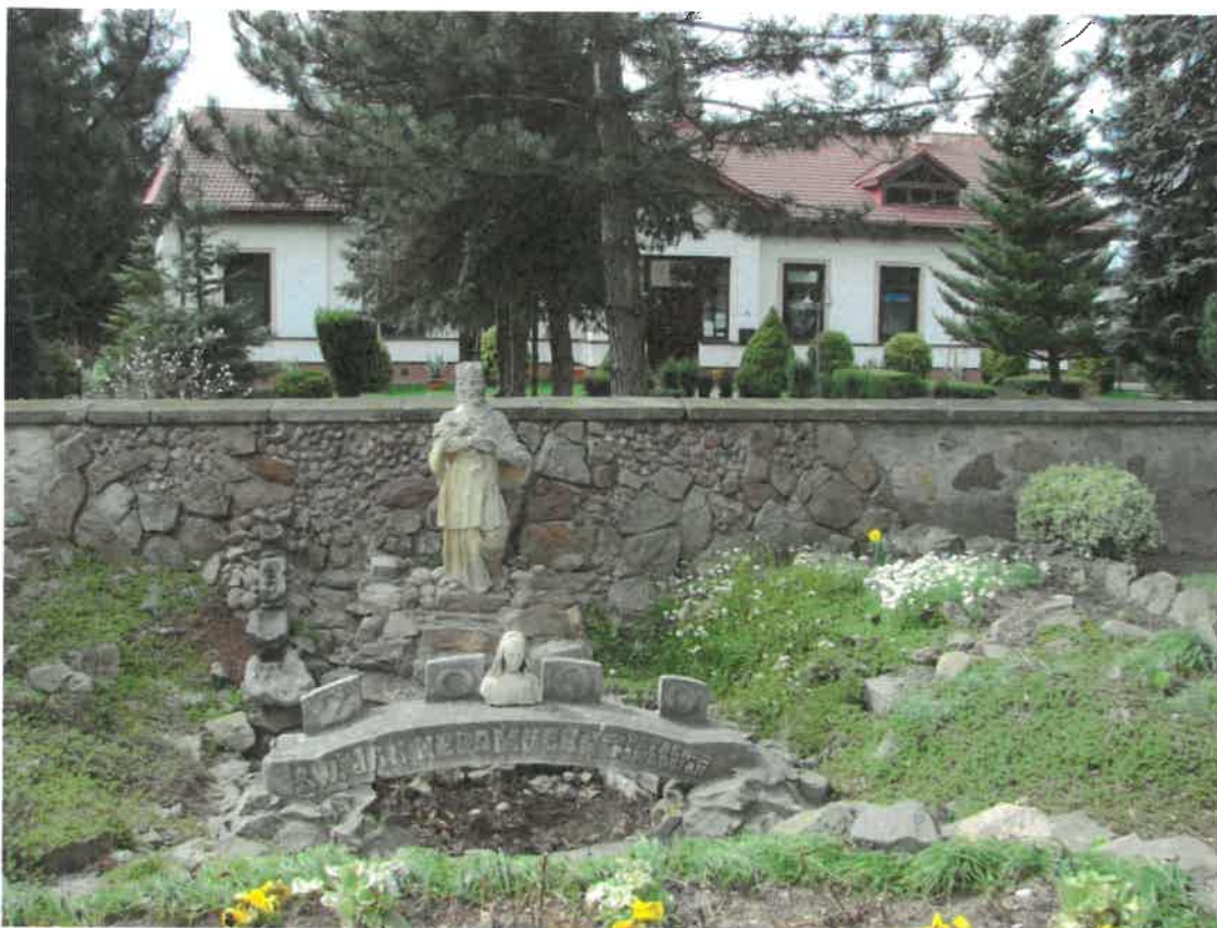
Plebania z początków XX wieku

W 2021 roku, w porozumieniu ze Świętokrzyskim Wojewódzkim Konserwatorem Zabytków w Kielcach sporządzono nowe karty adresowe Gminnej Ewidencji Zabytków (zgodnie z nowym wzorem karty adresowej, wprowadzonej w 2019 roku), które obejmują obecnie 40 zabytków architektury, budownictwa, elementów krajobrazu kulturowego Gminy Skarżysko Kościelne, w tym 18 stanowisk archeologicznych.