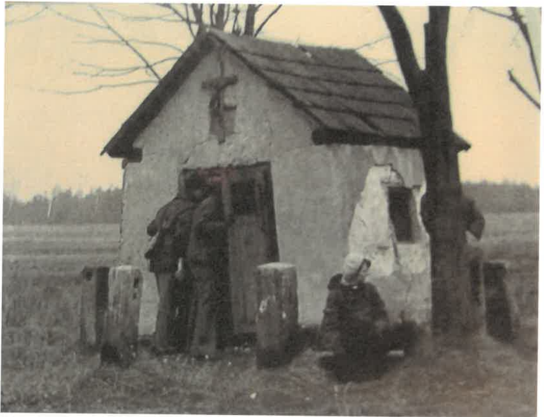
Zdjęcie archiwalne kapliczki wotywniej w Świerczku