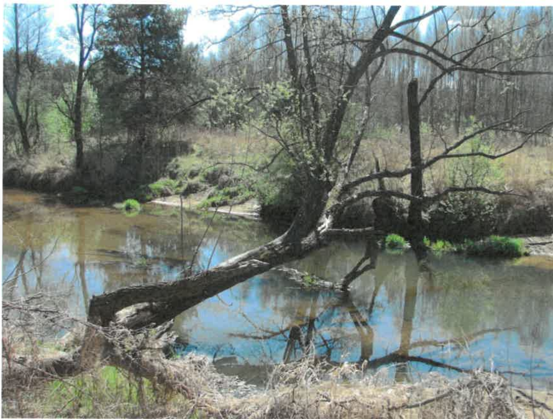
Rzeka Kamienna w Rezerwacie Archeologicznym „Rydno”

tlenkami żelaza, które w postaci hematytu były tu wydobywane w okresie epoki kamienia. Ochroną prawną objęty jest kompleks kopalń hematytu i towarzyszących mu stanowisk osadniczych na powierzchni kilkunastu kilometrów kwadratowych.