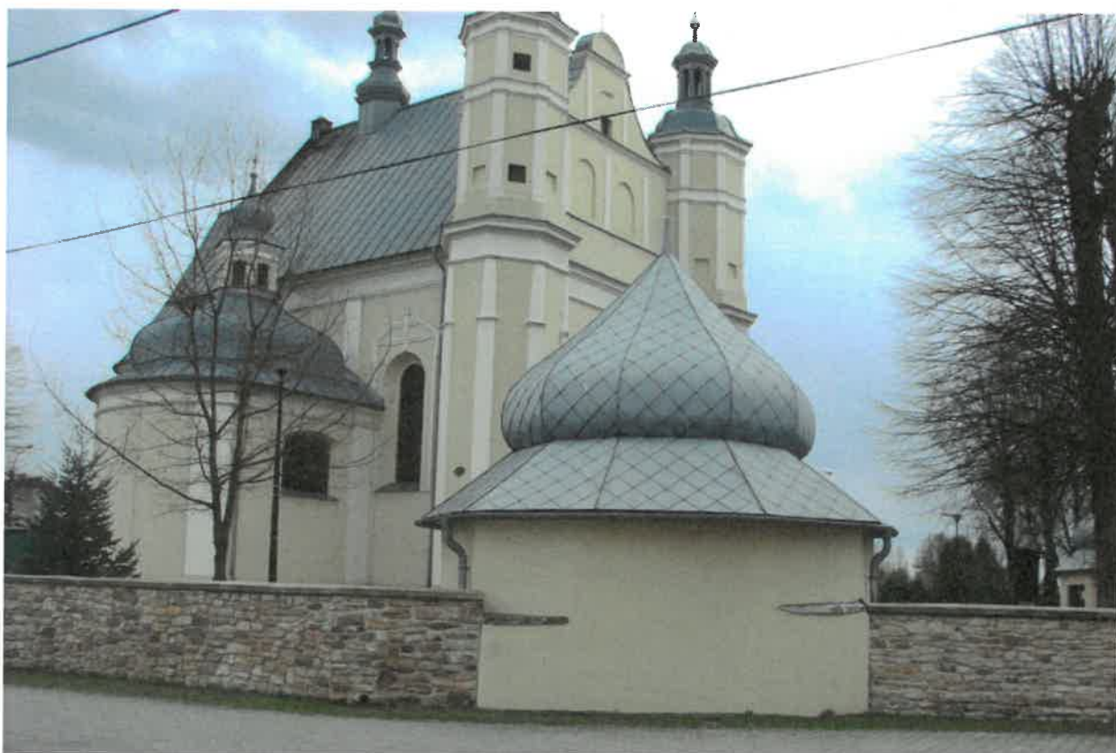
Zespół sakralny w Skarżysku Kościelnym