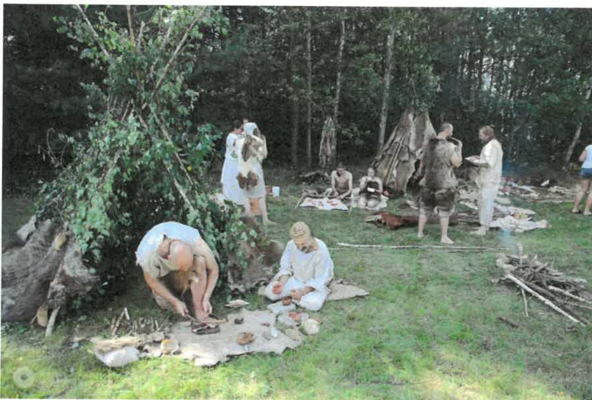
Grupy rekonstrukcyjne podczas pikniku parafialnego w Skarżysku Kościelnym

Na terenie gminy odbywa się również co roku festyn parafialny, który wśród rozmaitych propozycji rozrywkowych pełni również rolę oświatową. W jego trakcie prowadzone są pokazy życia codziennego w epoce kamienia i warsztaty edukacyjne z udziałem rekonstruktorów z oddziału PTTK Starachowice czy stowarzyszenia Praosada RYDNO i innych.