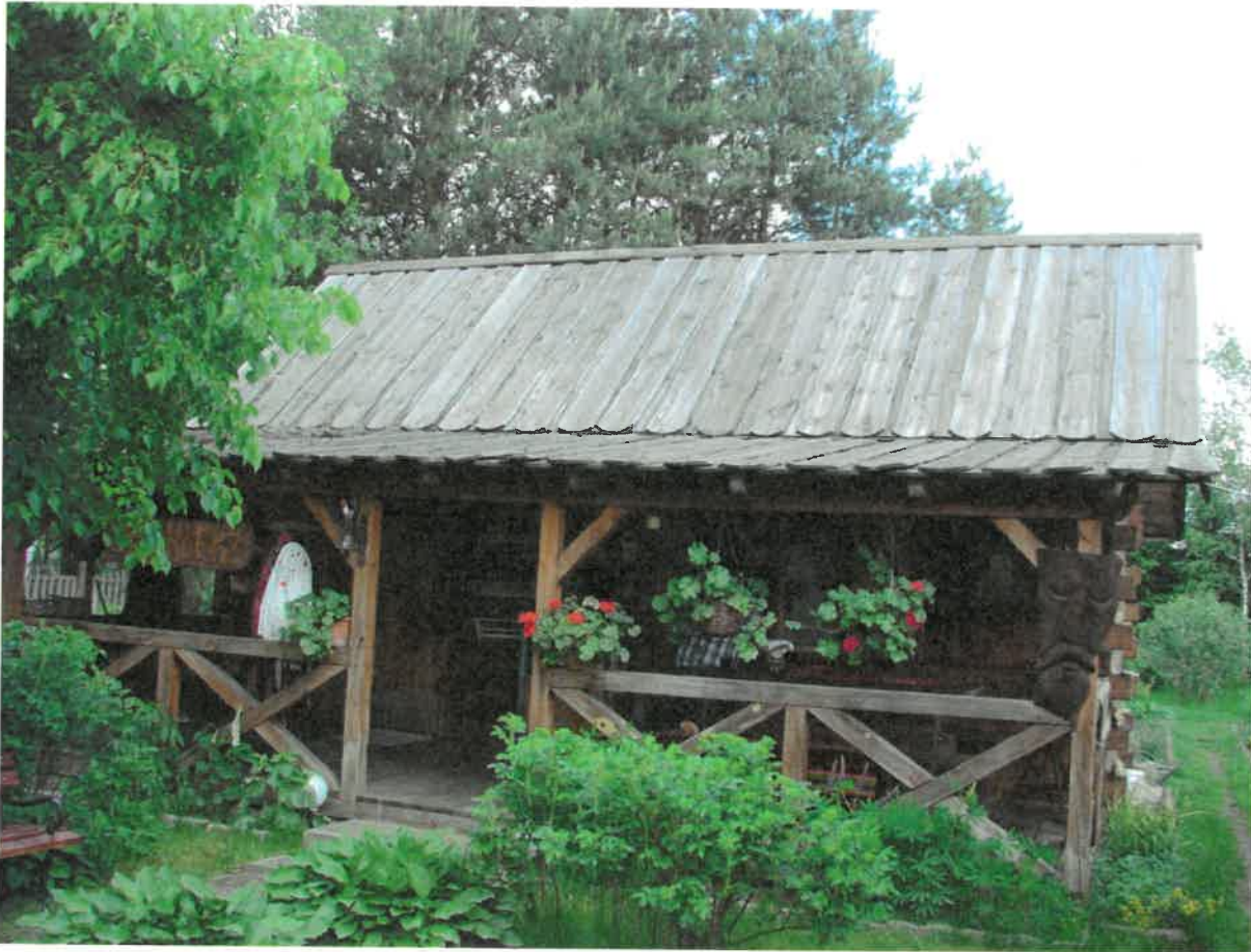
Spichlerz Regionalny państwa Jachów w Skarżysku Kościelnym