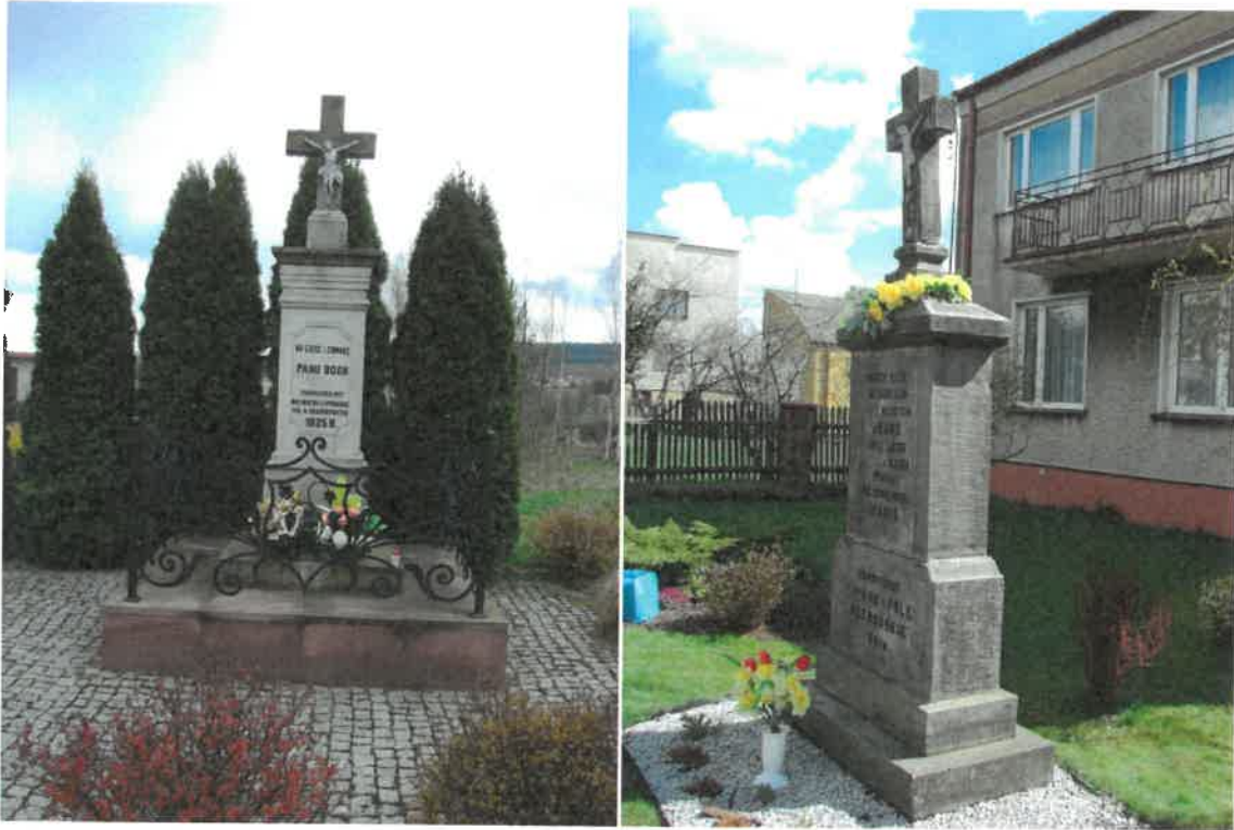
Krzyże przydrożne w Lipowym Polu Skarbowym i Plebańskim