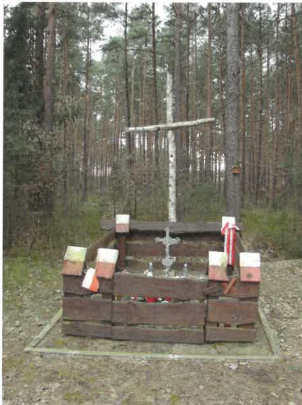
Pamiętki z Powstania Styczniowego: krzyż w Grzybowej Górze i mogiła powstańcza w Kierzu Niedźwiedzim