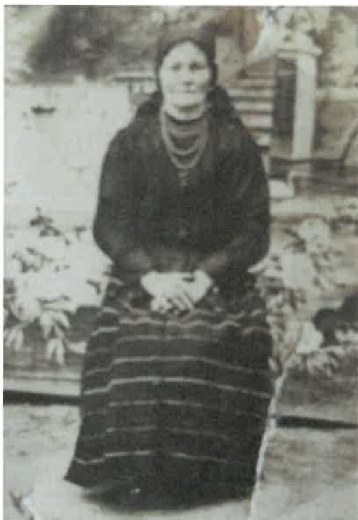
Strój kobiety z okolic Grzybowej Góry

Gwara tego regionu należy do dialektu małopolskiego, którego główną cechą jest przede wszystkim tzw. „mazurzenie”.