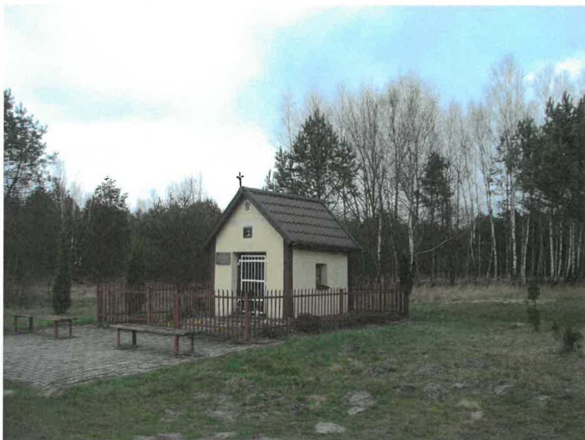
Kapliczka wotywna w Świerczku