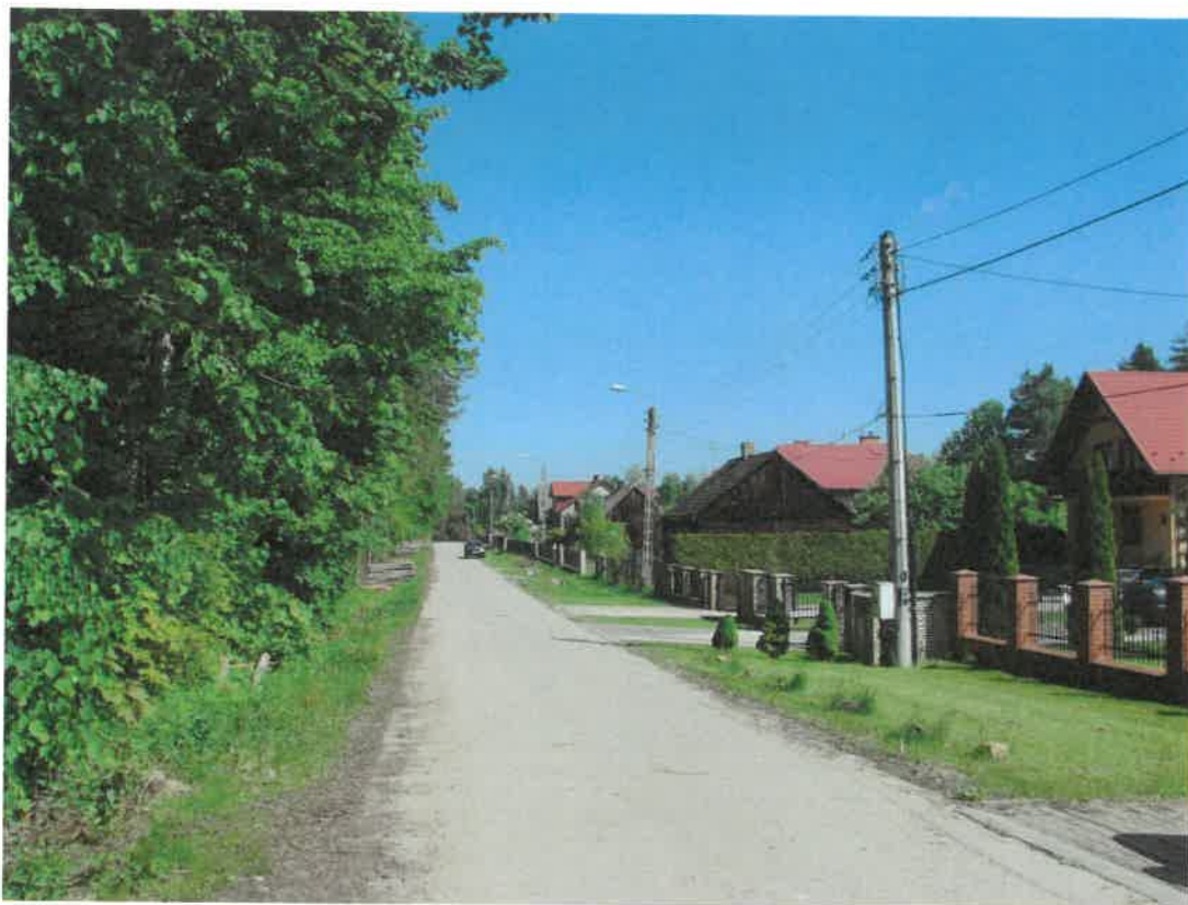
drewniana zabudowa w Majkowie

pojawiły się dwuspadowe lub naczółkowe. Charakterystyczne było łączenie pod jednym dachem obory i stajni. Budynki, raczej niewielkich rozmiarów, zestawiano w prostokątnych zagrodach, Domy mieszkalne miały bielone wapnem ściany, czasami dodatkowo malowane na niebiesko.