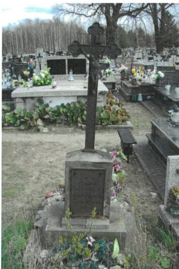
Nagrobek Celinki Rettinger na cmentarzu parafialnym