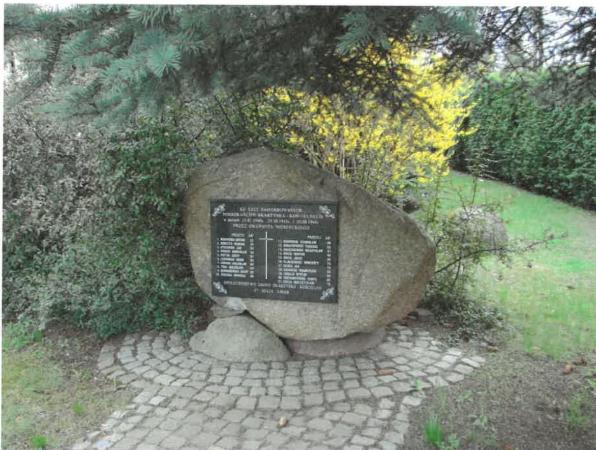
Obelisk w Skarżysku Kościelnym poświęcony mieszkańcom tej miejscowości zamordowanym w czasie II wojny światowej

Oprócz zabytków wpisanych do rejestru oraz ewidencji wojewódzkiej, należy wskazać również takie zabytki, które mają szczególne znaczenie dla społeczności lokalnej poprzez wyjątkowy związek z jej historią. Jest to np. mogiła powstańcza w Kierzu Niedzwiedzim z 1863 roku, pomniki (obeliski) oraz krzyże upamiętniające zamordowanych Polaków w czasie II wojny światowej w Skarżysku Kościelnym i Lipowym Polu Plebańskim , czy kapliczki upamiętniające Powstanie Styczniowe w Grzybowej Górze i Świerczku .