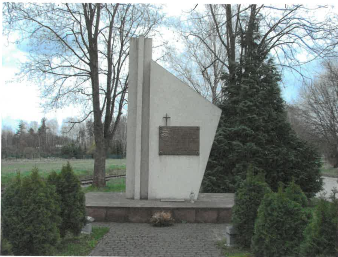
Pomnik ofiar egzekucji hitlerowskich z lat 1943-44 w Skarżysku Kościelnym

Równie cenne są krzyże czy figury przydrożne, oddające w opiekę bożą poszczególne rodziny czy całe społeczności poszczególnych wsi (kapliczki w Majkowie, Michałowie czy Lipowym Polu Skarbowym ). Prawdopodobnie proces wpisywania do gminnej ewidencji zabytków innych krzyży czy kapliczek jeszcze się nie zakończył, o czym może świadczyć wizja lokalna jaka odbyła się w trakcie opracowywania niniejszego programu w Lipowym Polu Plebańskim , a która miała na celu oględziny oraz stwierdzenie możliwości lub ich braku wpisania tego typu obiektu do GEZ.